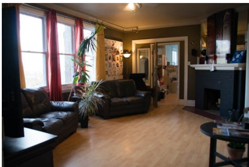
Salon Hospitalité Guy-Moreau Inauguré le 1er décembre 2011 Redécoré à l'automne 2016