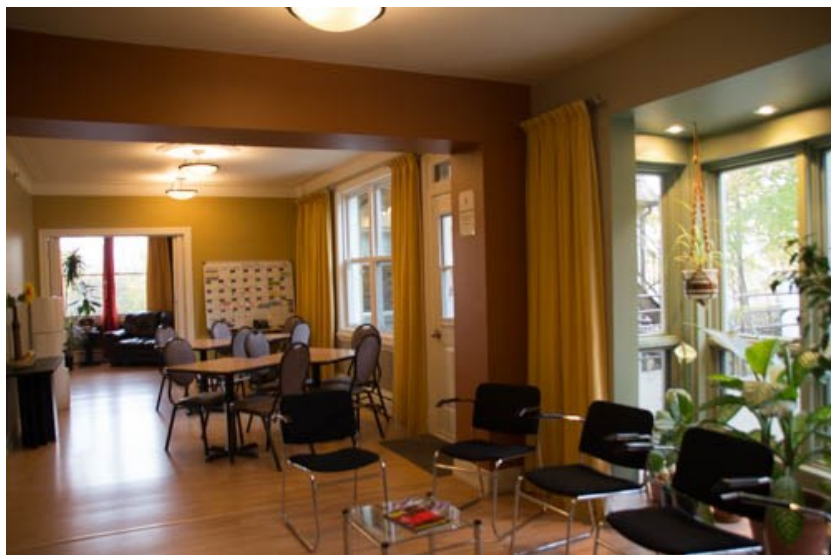
Salle Danielle-Lévesque Inaugurée le 1er décembre 2011 Redécorée à l'automne 2016

Il y a 5 ans, lors de notre 25 e anniversaire, un magnifique cahier souvenir relatait toutes les étapes importantes de même que l'histoire de notre organisme. C'est pourquoi, en 2016, nous nous attarderons sur les cinq dernières années. Notre organisme étant plutôt dynamique et le nombre de ses réalisations élevé, nous avons privilégié celles qui ont contribué au succès du MIELS-Québec.